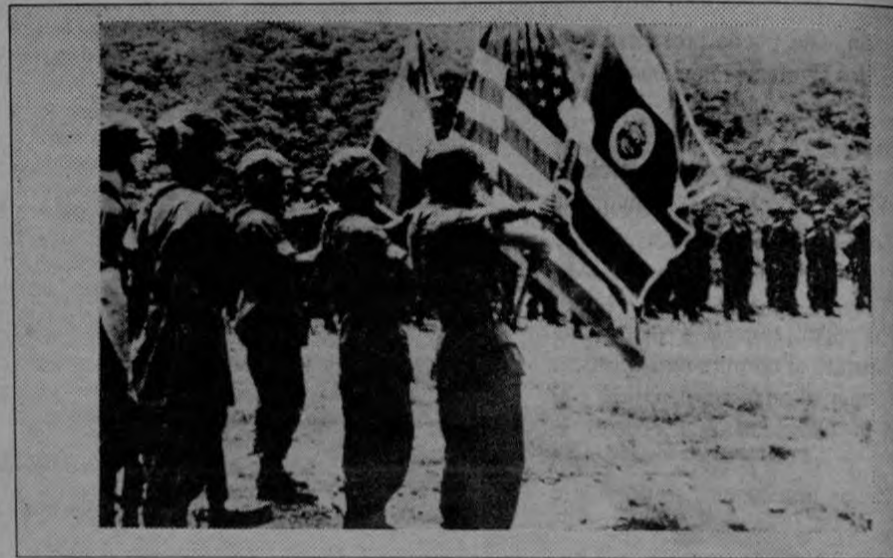
Con la peligrosa doctrina de la "seguridad nacional", algunos funcionarios y autoridades, están militarizando los organismos policiales costarricenses

Se sigue deteniendo también a gran cantidad de personas, sobre todo en el aeropuerto y puestos fronterizos. En estas detenciones se evidencia un patrón de persecución político-ideológico. Generalmente van acompañadas de requisamiento de documentos privados, violando no sólo el artículo 37, sino el artículo 24 de la Constitución que garantiza la